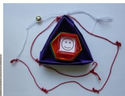
図-3 「環境」の入れ子状態

なお、環境カウンセラー登録者検索頁 https://edu.env.go.jp/counsel/list/ から辿る経歴等に誤りがあります。